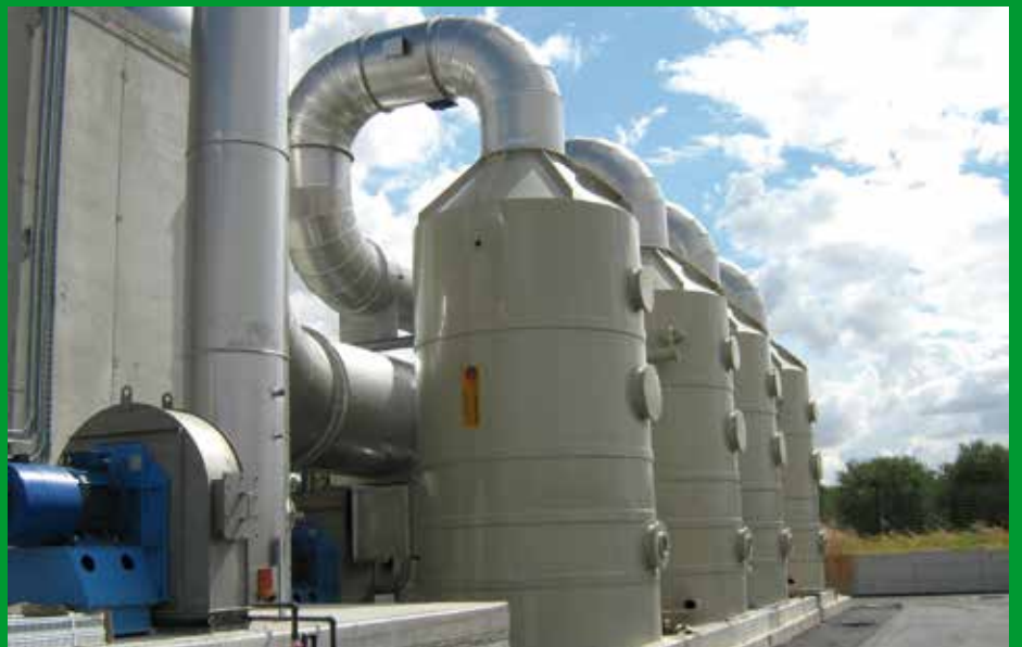
Scrubbers in Polipropilene Tours de lavage en Polypropène