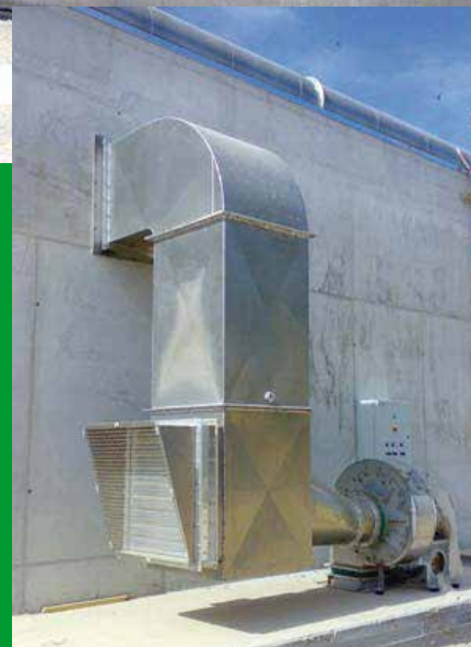
Aerazione biocella Aération des digesteurs aérobies