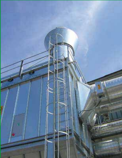
Sistemi di aspirazione su impianti per la produzione di C.D.R.