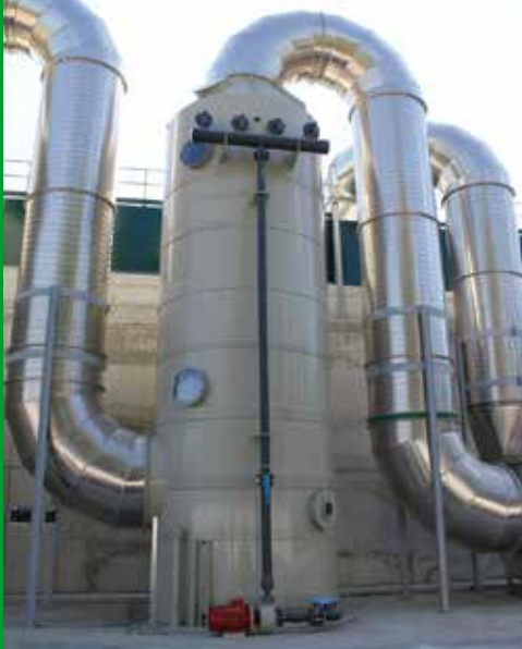
Scrubber in Polipropilene Tour de lavage en Polypropène