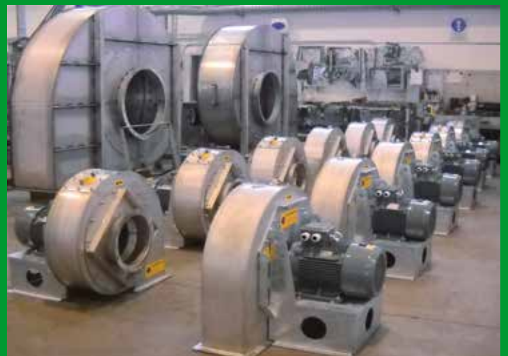
Aspiratori Centrifughi in AISI Aspirateurs centrifuges en acier AISI