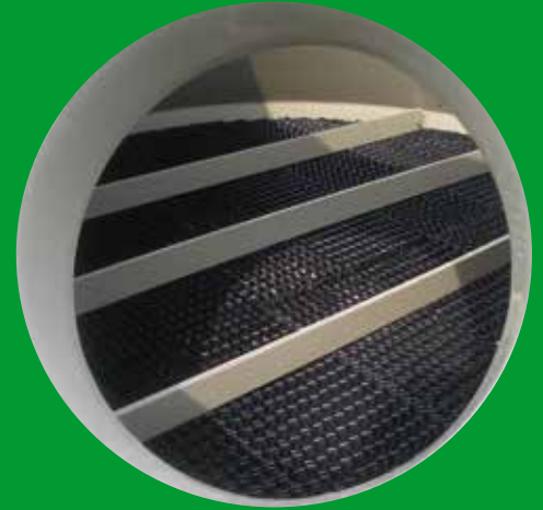
Separatore di gocce Séparateur de gouttes

La filtration par voie humide permet de réduire la concentration de substances présentes dans un courant gazeux, comme particules et micropolluants à caractère acide ou autres substances chimiques, en les absorbant dans l'eau, mélangée, si nécessaire, à des agents chimiques.