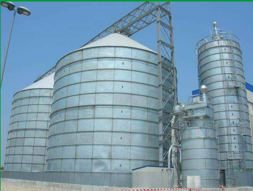
Silos di stoccaggio Silos de stockage

En présence de poussières explosibles, les installations sont construites en conformité avec la norme ATEX 94/9/CE.