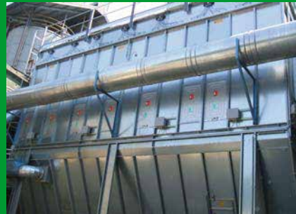
Systèmes d'aspiration sur installations pour la production de C.D.R.