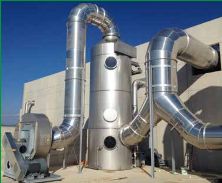
Scrubbers in AISI Tours de lavage en acier AISI

En présence de poussières explosibles, les installations sont construites en conformité avec la norme ATEX 94/9/CE.